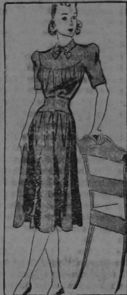
With new full-hipped shirt