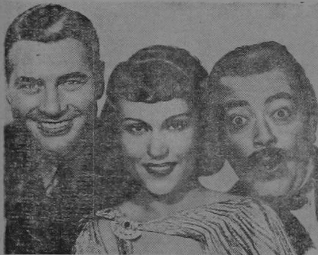
no parece asustar a estos tres: Richard Arlen, Fay Wray y Raymond Walburn, encabezan el elenco del nuevo film Columbia "La Muerte Anónima".